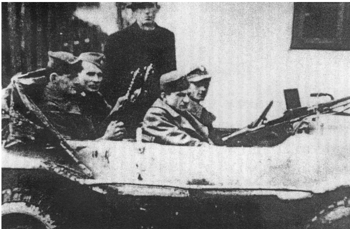
Slika 2. Petar Rajkovačić zapovjednik odžačke obrane (sedmi vitez NDH) s pratnjom.