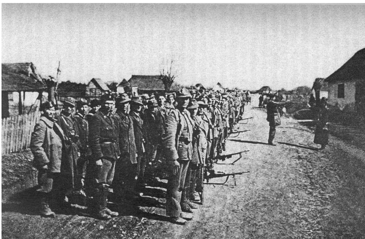
Slika 3. Branitelji odžačke Posavine na jednom od postrojavanja. 76